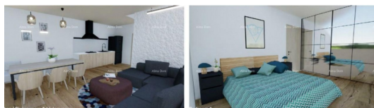
Living room & Dining room